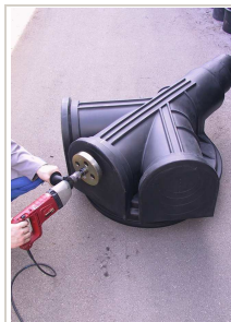
Izvedba ulaznog priključka