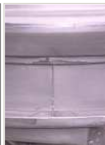
Položaj spoja nakon pritiskanja