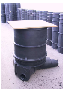
Namještanje ploče min. veličine kao obruč okna