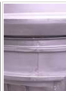
Položaj spoja prije pritiskanja