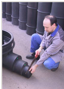
Izvedba izlaznog priključka