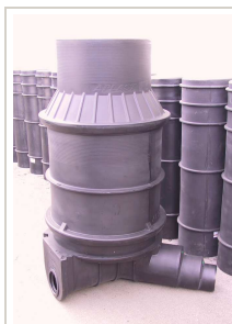
Modularno PE okno pripremljeno za ugradnju