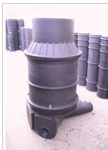
Namještanje novog obruča ili konusa