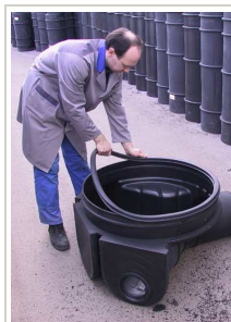
Namještanje brtve PE okna