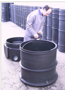
Odrez- čišćenje unutarnjeg ruba na obruč