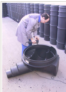
Odrez unutarnjeg ruba na kineti okna