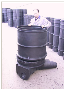
Namještanje obruča na kinetu okna