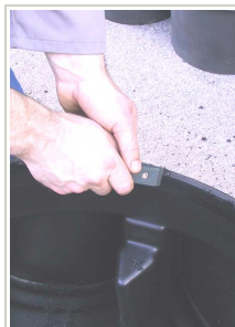
Čišćenje strugotine na odrezu